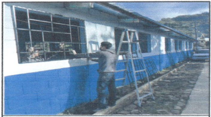
Foto 4: Instalación de ventanas de madera por ventanas de metal mas vidrio en módulo I ()