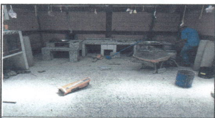
Foto 5: Sustitución de piso rústico por piso de granito y pintura en muros exteriores e interiores. Cocina