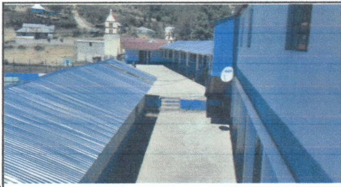
Foto1: Establecimiento Educativo